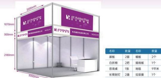
展商可额外制作画面尺寸表