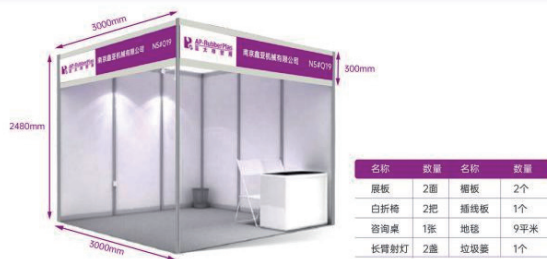
展商可额外制作画面尺寸表